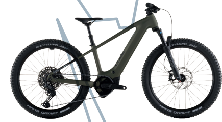
CUBE ACID 240 HYBRID ROOKIE SLX 400X Kids