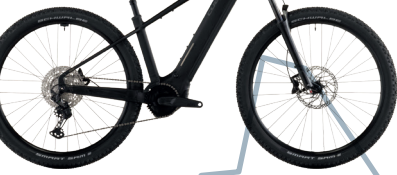
CUBE REACTION HYBRID PRO 800