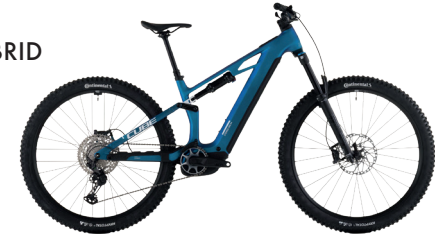
CUBE STEREO HYBRID ONE44 HPC SLX 800